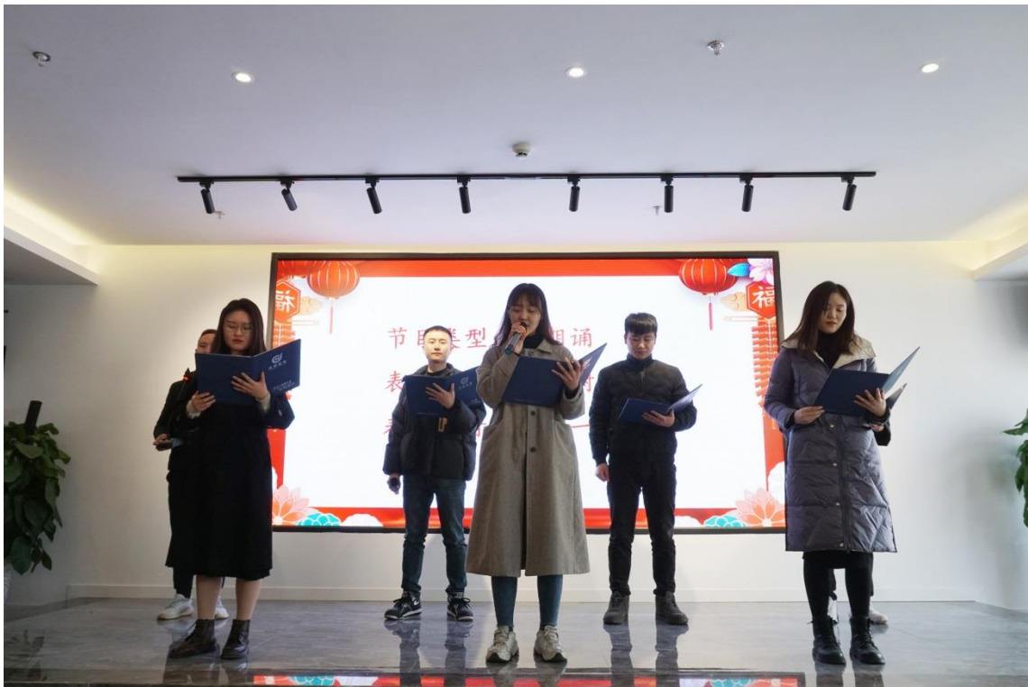
2021年1月公司春节茶话会