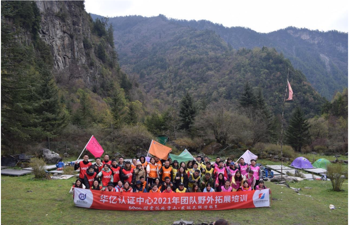
2021年4月公司团建活动